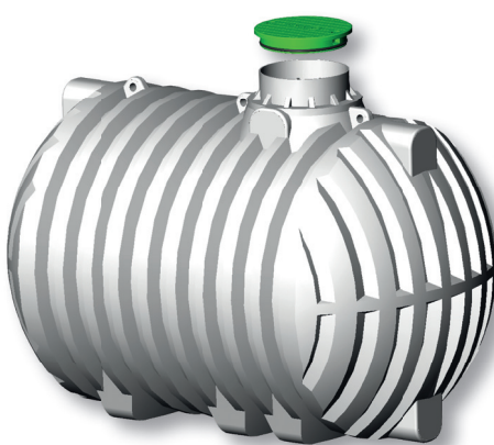
za pitku vodu (certifikat W 270)