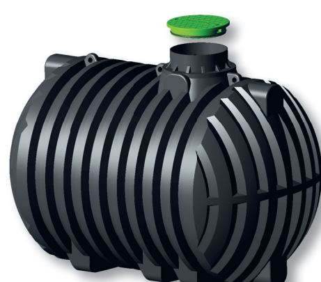
za otpadne vode